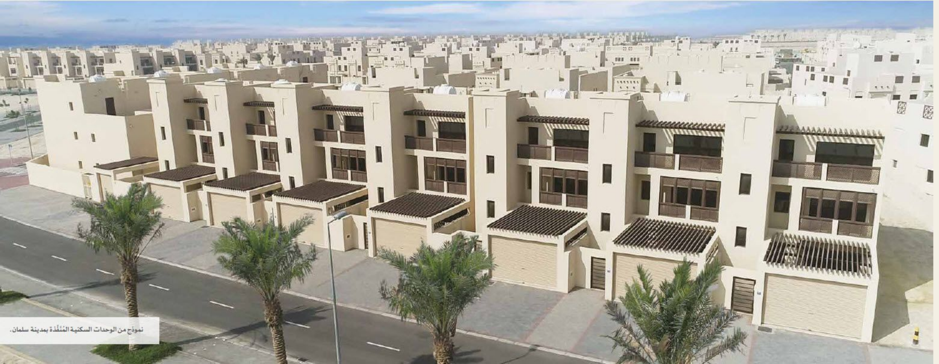
نموذج من الوحدات السكنية المُتَّخِذة بمدينة سلمان.