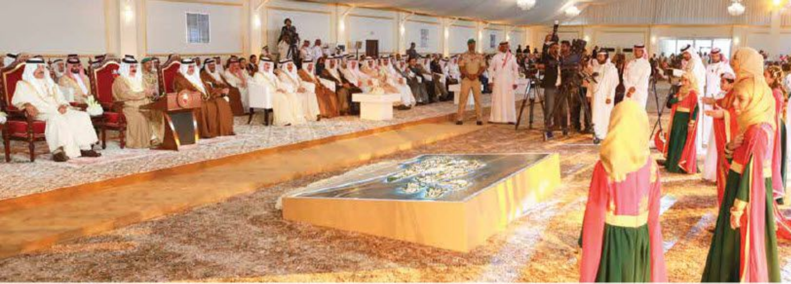
جانب من الأوبريت الشعري خلال افتتاح مدينة سلمان. 15 مايو 2018