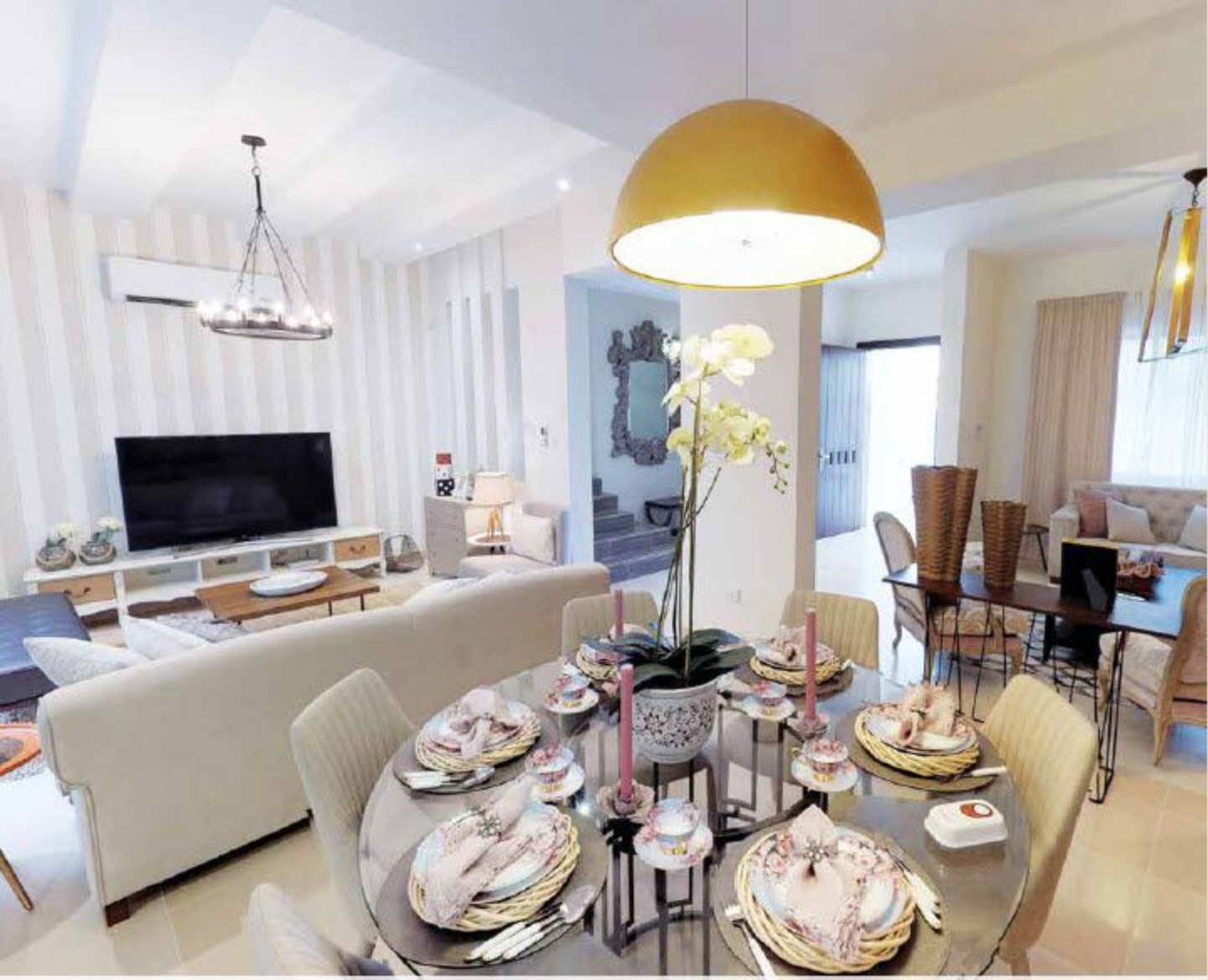
نموذج من الوحدات السكنية المُنتَدة بديرية العيون.