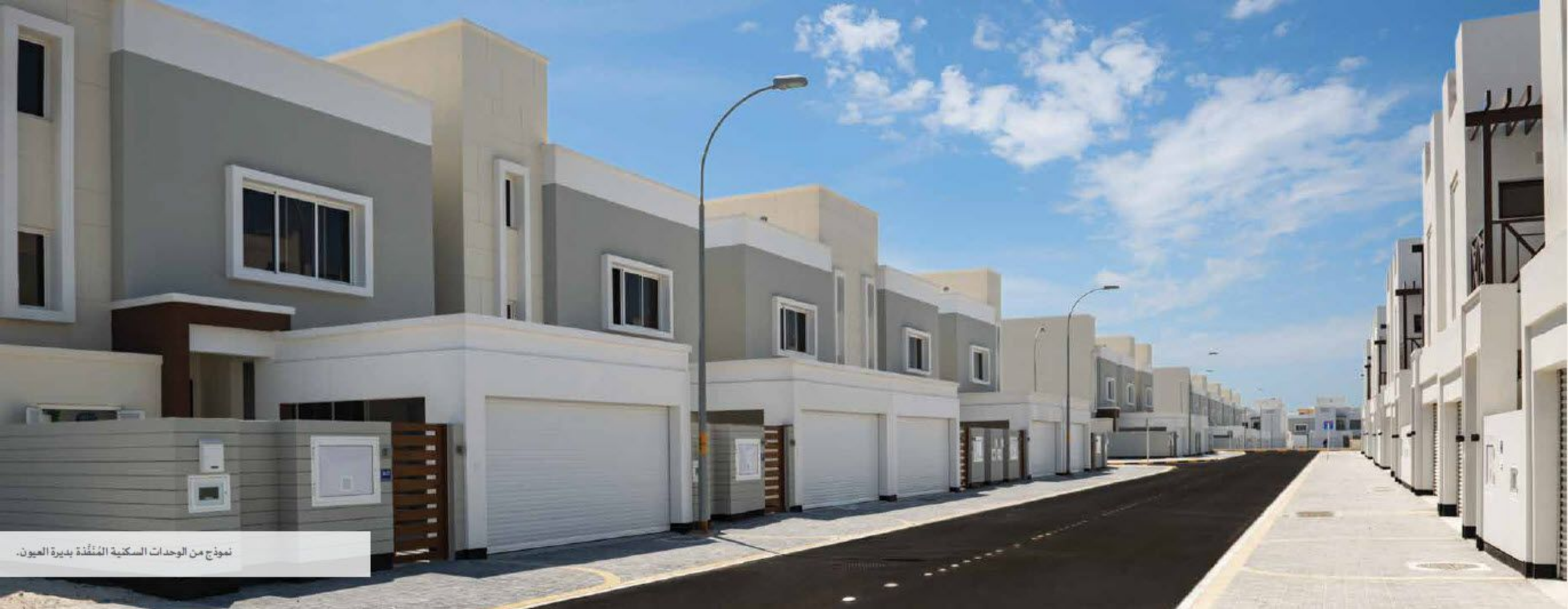
نموذج من الوحدات السكنية المُتَمَنِّدة بديرة العيون.