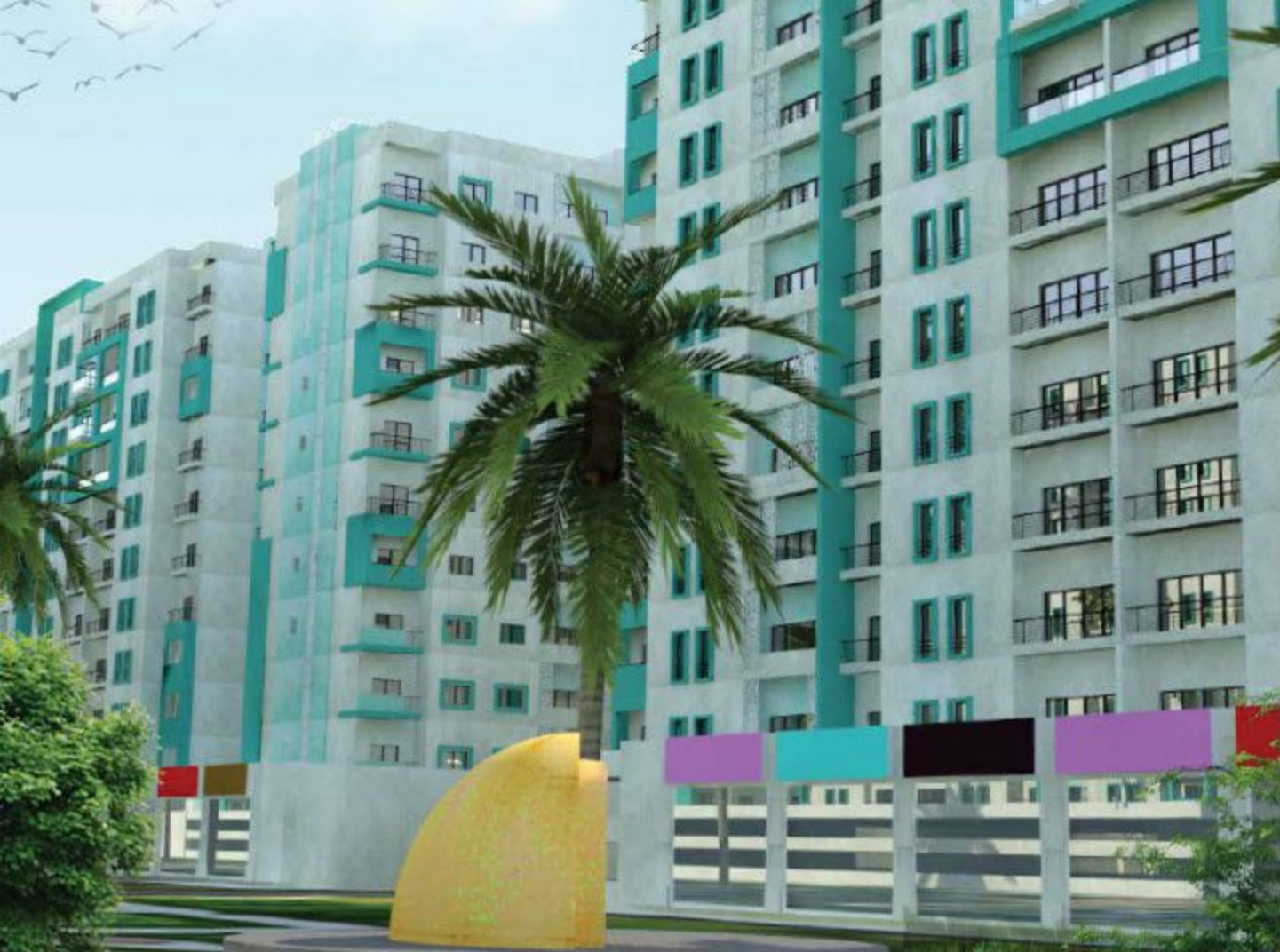
صورة تخيلية لمشروع ضاحية الرملي.