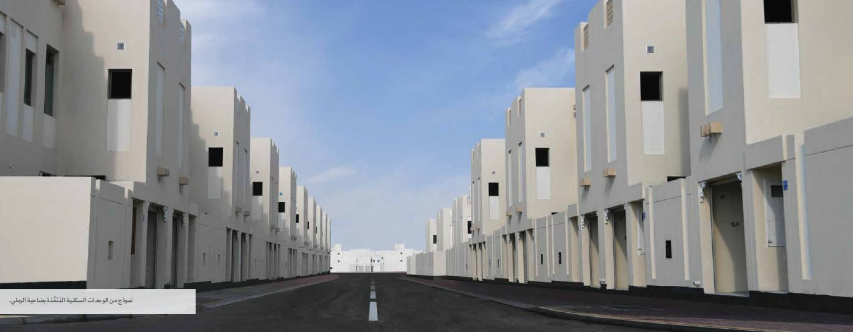
نموذج من الوحدات السكنية المُتَمَكِّدَة بضاحية الرملي.